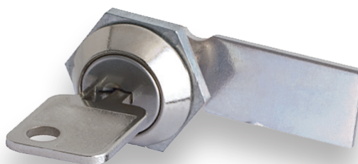
280 FECHO min. 50 un.