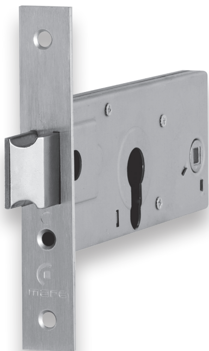
727 FECHADURA S/ CILINDRO min. 60 un.